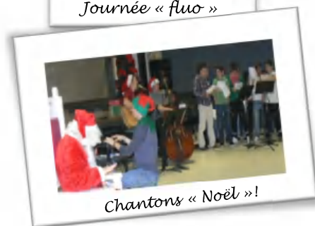
Chantons « Noël »!