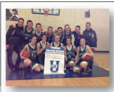
L'équipe féminine de basketball juvénile AAA a remporté les grands honneurs au tournoi annuel du Pré-U à Gatineau.