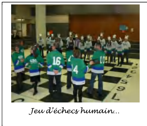
Jeu d'échecs humain...