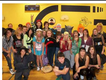
Activité d'halloween 2011