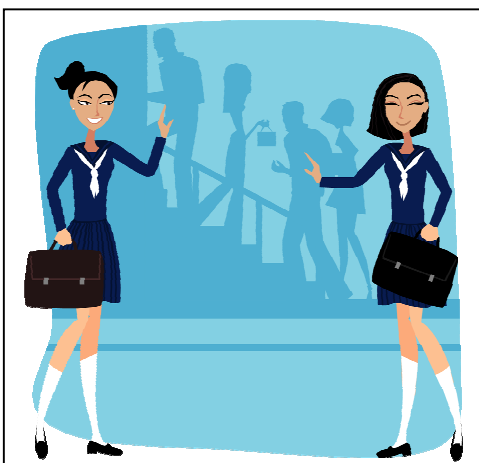
Lancement du DVD contre l'intimidation. 17 mai 2012