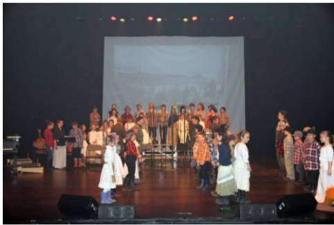
Prestation dans le cadre de la 27 e édition de la semaine des arts