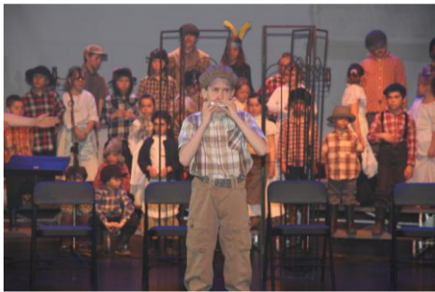
Prestation dans le cadre de la 27 e édition de la semaine des arts