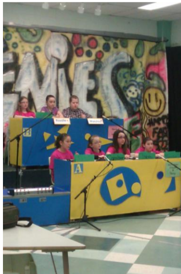
Toute une partie de Génies en herbe