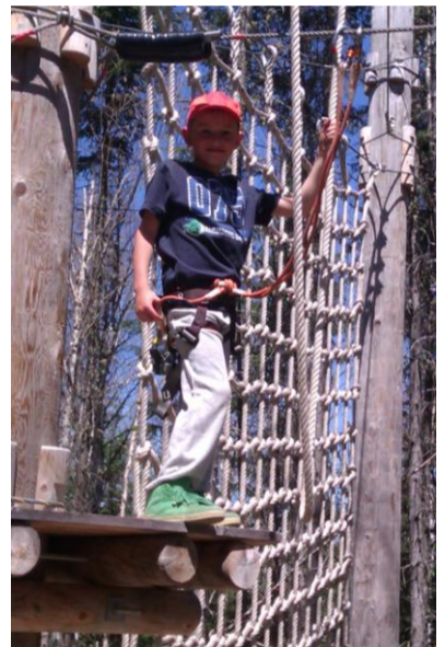
Arbre en arbre tout un plaisir