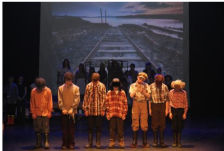
Prestation dans le cadre de la 27 e édition de la semaine des arts