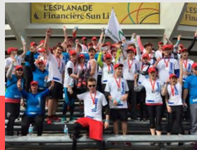
Champions régionaux, toutes catégories, en athlétisme extérieur