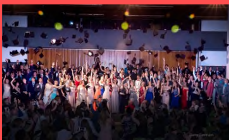
Le lancer du mortier au bal des finissants