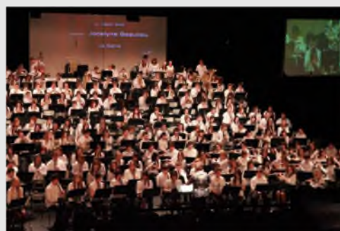
30 e Grand rassemblement des harmonies