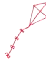
TABLEAU DES HONNEURS