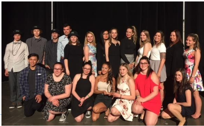
Célébration des réussites 2017-2018 Équipe enseignante