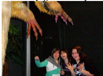
Mai Le voyage à Sudbury