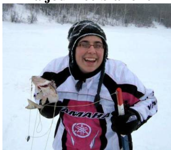
Mars La journée blanche