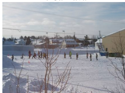
Février Le Carnaval