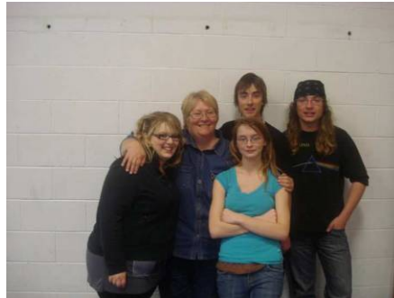
Secondaire en spectacle 2011