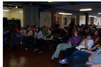
Décembre Fête de Noël